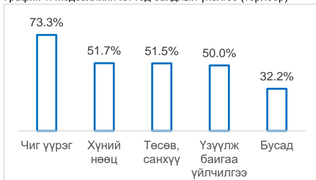
График 1. Мэдээллийн ил тод байдлын үнэлгээ (төрлөөр)